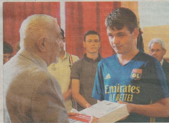
Des lycéens d'Oudinot ont lu les biographies des déportés haut-marnais avant de remettre l'ouvrage à leur famille.

La Haute-Marne compte 378 personnes natives du département et 198 habitants déportés. Aussi, 23 résidents ayant quitté le département dans les années 1939 et 1940 ont subi le même sort. Enfin 28 personnes ont été arrêtées dans le département sans y être rattachés, souvent des résistants en mission. Sur ces 627 déportés, 371 ne sont jamais revenus des camps.