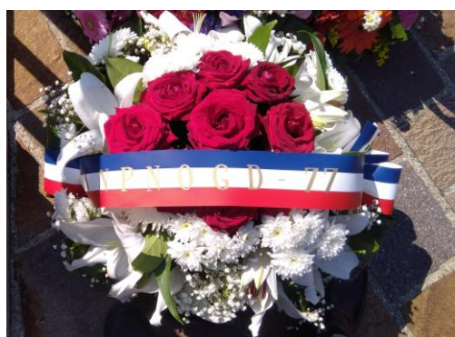
La gerbe de l'ANPNOGD 77

La Cérémonie était clôturée par les salutations des Autorités aux porte-Drapeaux et Membres des Associations présentes. Et échanges de quelques instants entre Mme la Sous –Préfète et notre Présidente et notre Vice-Président de la délégation 77